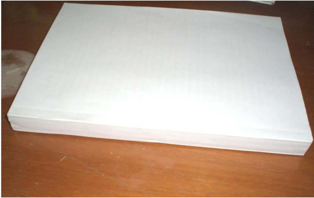
(注：上图为正确的封底格式)